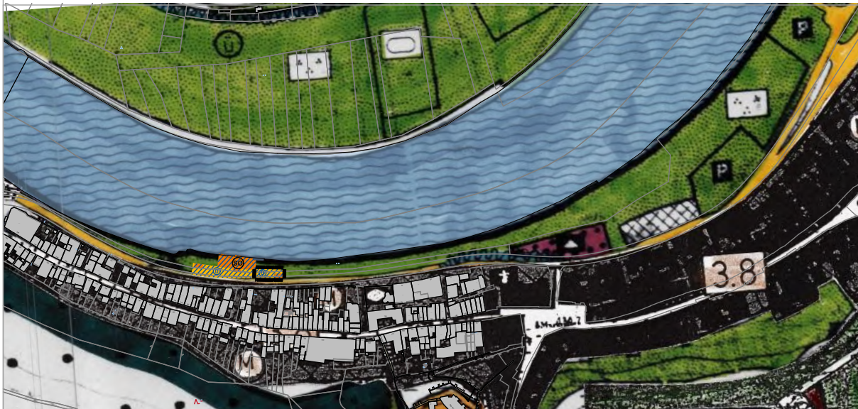
Änderung des Flächennutzungsplans