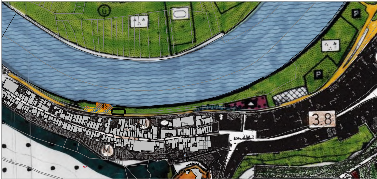
Ausschnitt aus der aktuellen Fassung des FNP der Stadt Miltenberg (Bereich der Erweiterung des Bebauungsplans "Verkaufspavillon Mainpier") mit Kennzeichnung des Geltungsbereichs der Erweiterung