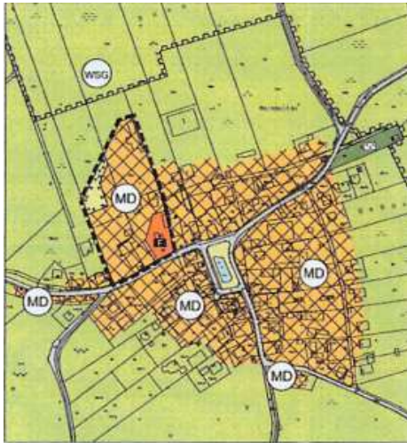
seit 18.11.15 wirksamer FNP ohne Darstellung der Ausgleichsfläche (links)