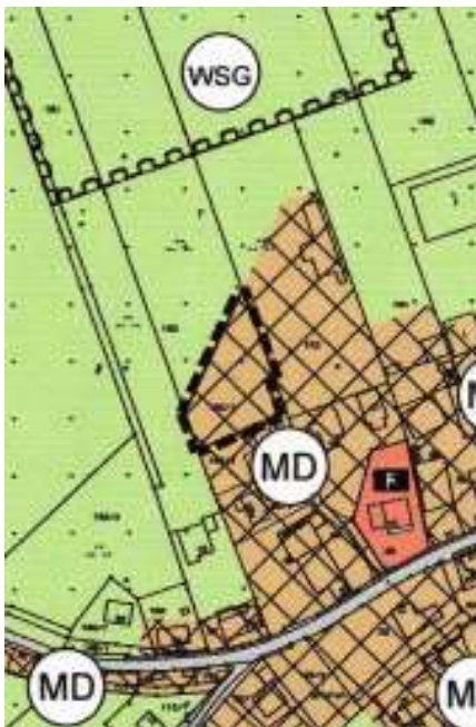
FNP-Plan erste Beteiligung