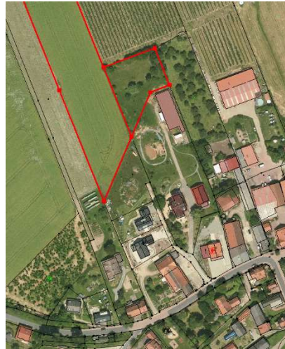
Luftbild mit Fl.Nr. 163/2 (rechts) und Fl.Nr. 162 (links)