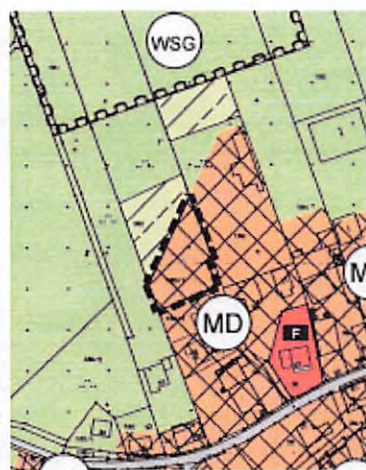
FNP-Plan zweite Beteiligung