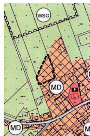
FNP-Plan erste Beteiligung

Nach Rücksprache mit dem Landratsamt wurde folgende Vorgehensweise vereinbart: